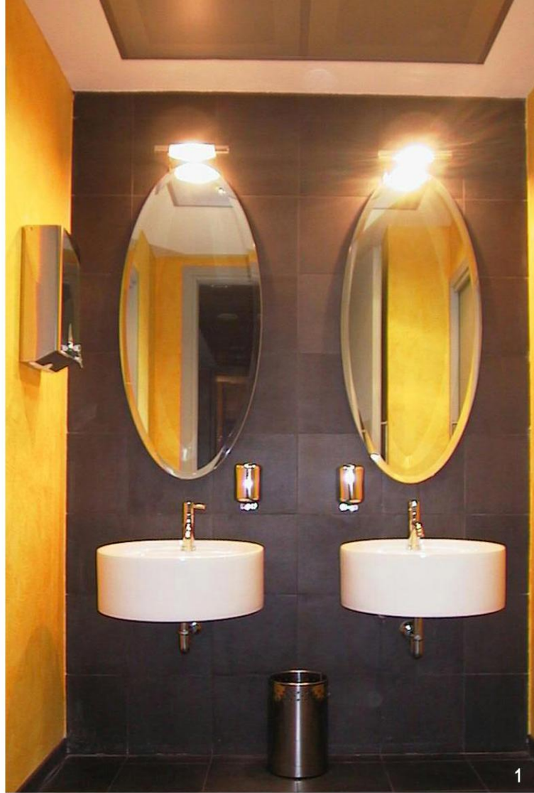
1 Servizi 2 Sala riunioni 3 Rampa scale